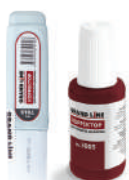
Корректор для ремонта царапин

Расчет кровельной лестницы: длина ската ÷ 3 = количество компл-в. Расчет: высота стены от карниза до отмостки ÷ 3 = количество компл-в.