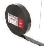
Уплотнительная лента под контробрезетку X-Band

Предотвращает проникновение птиц и насекомых в подкровельное пространство. Монтаж: вдоль карнизного свеса крепится саморезом ПШ 4,2x25 каждые 250 мм.