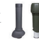
Вентиляционный выход/выход вентиляции канализации

Позволяют производить раскрой листов продукции, сохраняя гарантию. Расчет: 1 насадка на 1 заказ.