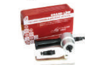
Насадка на дрель «Стальной бобер»

Позволяют производить раскрой листов продукции, сохраняя гарантию. Расчет: 1 насадка на 1 заказ.